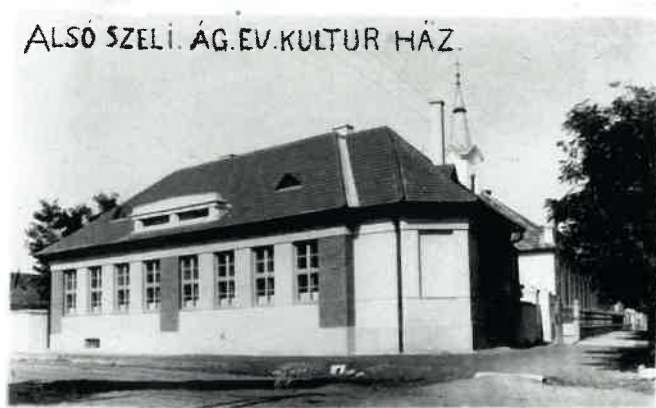
ALSÓ SZELI. ÁG. EV. KULTUR HÁZ.