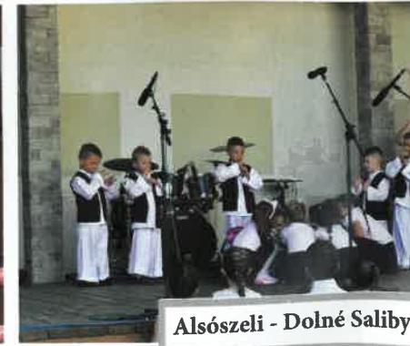
Alsószeli - Dolné Saliby